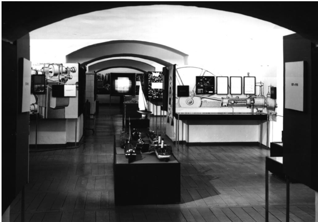
Dauerausstellungsraum, Anfang der 1970er Jahre

„In Vorbereitung des 20. Jahrestages der Gründung unserer Republik werden weiterhin folgende Ziele gestellt: Im einzurichtenden Heimatmuseum ist zum 20. Jahrestag der Republik eine Ausstellung zum Thema: 20 Jahre DDR und zur Geschichte der deutschen Arbeiterbewegung zu gestalten ... Die Arbeiten zur Errichtung des Heimatmuseums sind mit